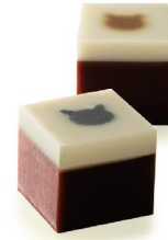
チョコ羊羹まちなこ 1月下旬から12月下旬