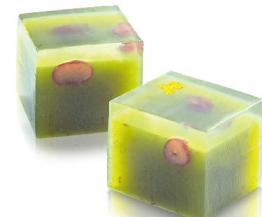
いろどり(茶摘) 4月下旬から5月下旬