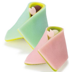
男雛・女雛 2月中旬から3月3日まで