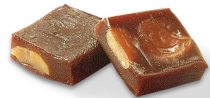
栗ういろう 9月下旬から11月上旬