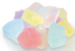
氷室 4月下旬から8月末まで