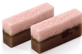
花かげ 4月上旬から5月下旬