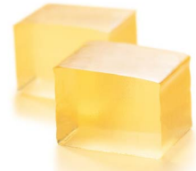
琥珀糖 6月上旬から8月中旬