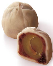
栗まる 8月下旬から12月末まで