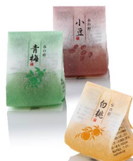
水の彩 4月中旬から8月末まで