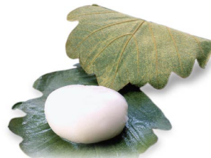
柏餅 4月中旬から5月下旬