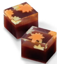
いろどり(紅葉) 8月下旬から10月下旬