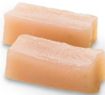
ご縁ういろう(桜) 3月上旬から4月上旬