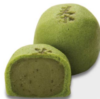
八十八夜 4月上旬から5月中旬