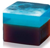
満天 6月上旬から8月中旬