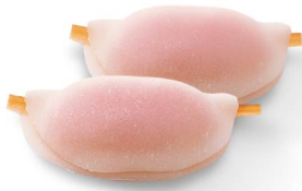
花びら餅 12月下旬から1月上旬