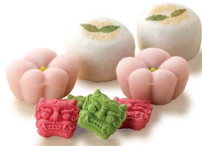
立春大吉 1月下旬から節分まで