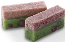
松垣 8月下旬から9月下旬