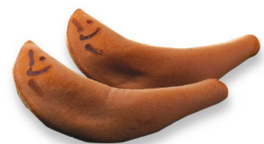
若鮎 5月中旬から6月下旬