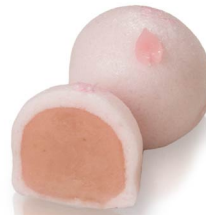
はな桜 2月中旬から4月初旬