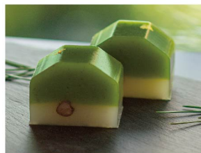
翠松 12月下旬から1月上旬