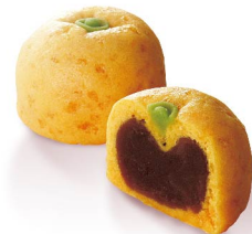
柚子上用 11月上旬から1月上旬