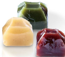
彩雲羊羹 9月下旬から3月末まで