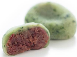
蓬餅 2月中旬から3月中旬