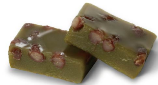
ご縁ういろう(抹茶) 4月上旬から5月上旬