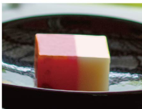
八千代 11月上旬から1月上旬