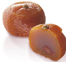
柚衣 11月上旬から12月末まで