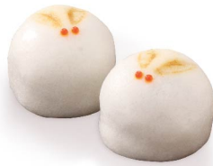
月のうさぎ 8月下旬から9月下旬