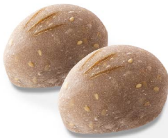
亥の子餅 11月上旬から11月中旬